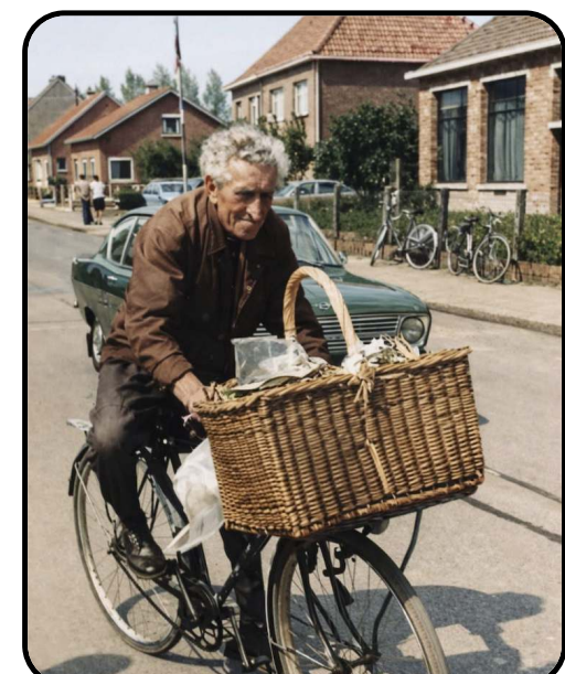
Herinnert u zich deze nog?

Er was zelfs al vraag om deze gezellige namiddag nog eens te herhalen, wat alleen maar aantoont hoe geslaagd het was. Kortom, het was een zeer geslaagde en gezellige namiddag!