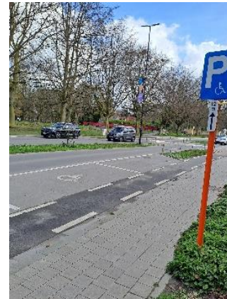
Foto is genomen aan het zwembad in Lokeren. Onlangs kreeg iemand een boete omdat hij geparkeerd stond in het parkeervak waarin niet het symbool “persoon met een handicap” was aangebracht (het voorste vak).

Er staat evenwel een verkeersbord “parkeren voorbehouden voor voertuigen die gebruikt worden door personen met een handicap” met een onderbord “12 meter”.